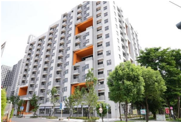
員和青年社會住宅

為扶植與培育優質創業團隊，新北市政府青年局（下稱本局）運用土城區員和段青年社會住宅公益空間打造土城綠創基地(土城區莊園街 151 號 2 樓)，招募具綠能減碳、環境永續、循環經濟等具綠色創新特色之相關技術、產品、服務或構想之新創團隊進駐基地，提供辦公空間、業師輔導、創業課程等資源，協助新創團隊進行市場驗證、商機合作鏈結、促成募資及加速事業發展，活絡新北綠色永續創新產業發展。