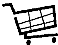
個人花費及2-3次 街市探訪自費餐