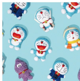
▲ 豐富展覽限定周邊，從日常小物到可愛擺飾，趕緊來入手。