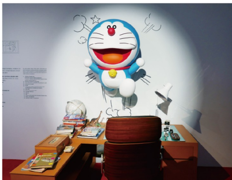
▲ 藤子·F·不二雄老師復刻工作室首度在台公開，一同探訪哆啦A夢誕生之地。

深受大小朋友喜愛的哆啦A夢與他的好友們再次齊聚於台北，這次更帶著特別祕密道具——「100%朋友召喚鈴」，邀請各位朋友們一同玩樂，現場將展出眾多造型立體雕塑、複製原畫手稿以及多種沉浸式場景，並將復刻藤子·F·不二雄老師的工作室，各種充滿無限想像力的神奇道具，帶領大家與哆啦A夢共同創造美好回憶。