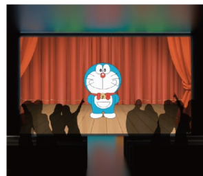
▲ 沉浸式體驗哆啦A夢微型劇場的異想世界。