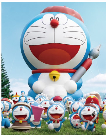
▲ 超過百種立體可愛造型哆啦A夢一次捕捉。