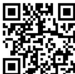
校長報名 QR code